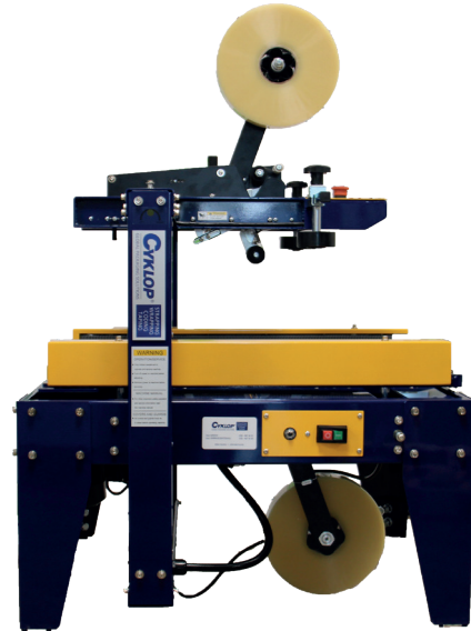
Standard version of the CT 102 SD

CT 102 SD:llä on mahdollista sulkea ammattimaisesti kymmeniä paketteja päivässä.