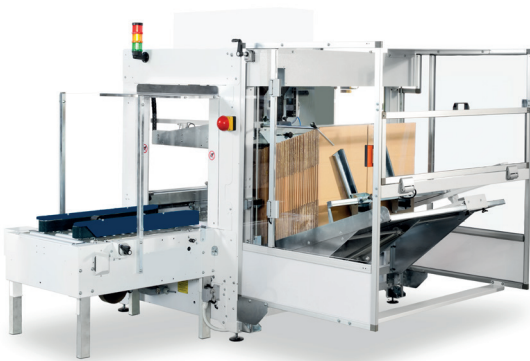
CT 3000 ja laatikonsulkija CT 302 SD