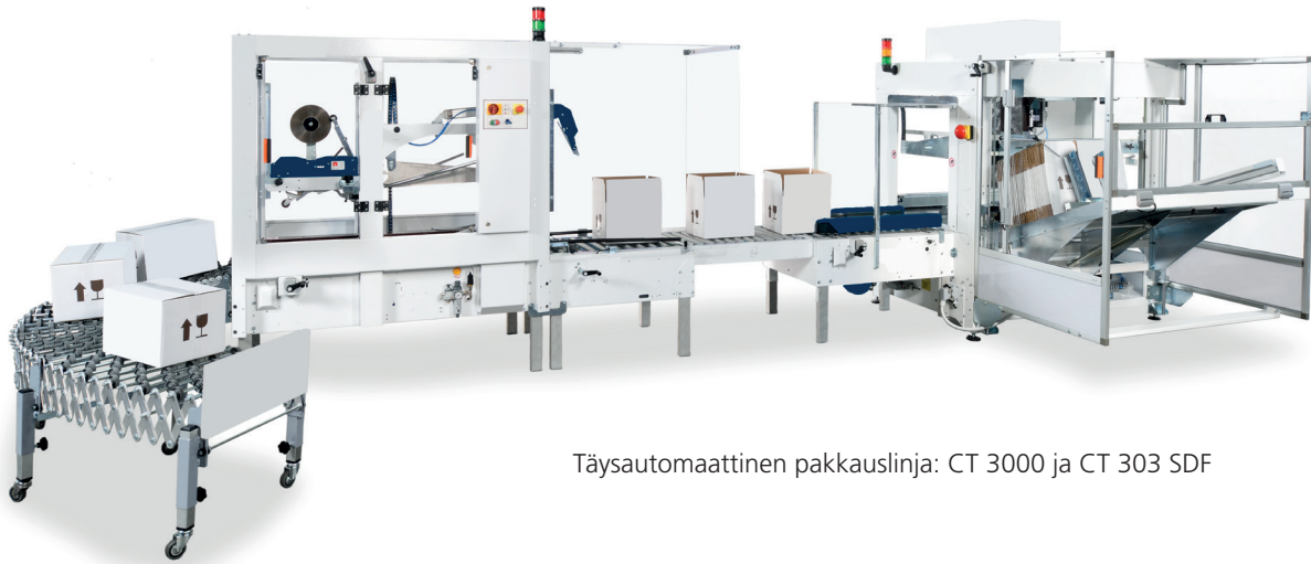
Täysautomaattinen pakkauslinja: CT 3000 ja CT 303 SDF

CT 3000:lla on mahdollista pystyttää ammattimaisesti tuhansia laatikoita päivittäin.