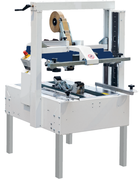
CT 303 TB vakioversio