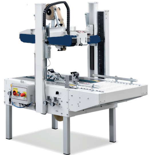
CT 305 TBR vakioversio